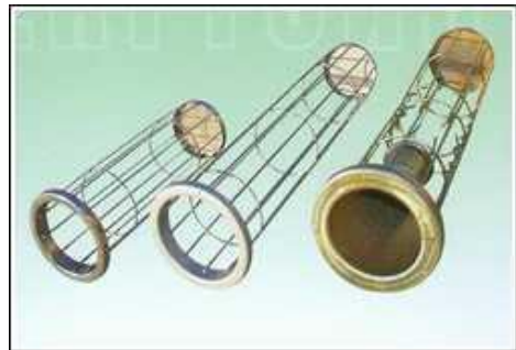
各种接头方式除尘框架