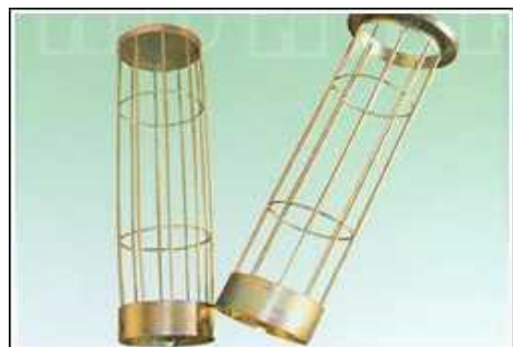
各种接头方式除尘框架