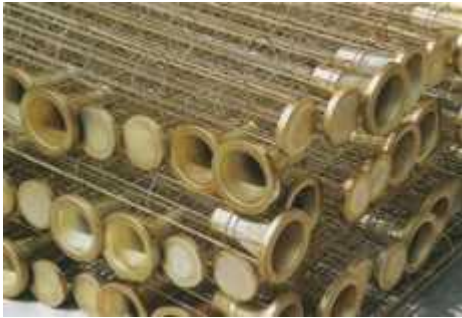
高炉煤气专用除尘框架

生产类型为：1. 圆袋型（外滤袋）2. 圆袋弹簧型（外滤式）3. 扁袋型（外滤式）（椭圆形、菱形）4. 信封型 5. 多节式框架（椭圆型多节框架，圆袋型多节框架（插节式、卡盘式））6. 成品框架（带文氏管的框架，塑料袋、铁架包装的框架，排列整齐的菱形框架）