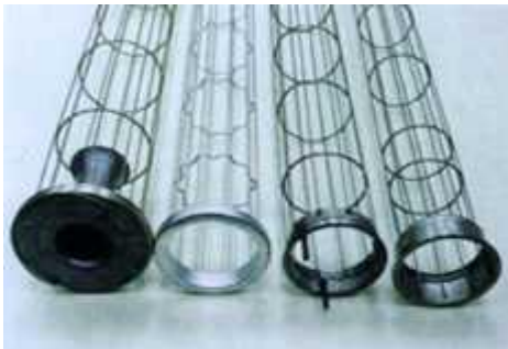
各种接头方式除尘框架