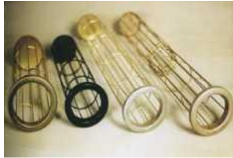
高炉煤气专用除尘框架