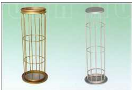
各种接头方式除尘框架